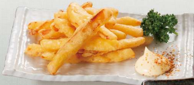
さきいかの天ぷら