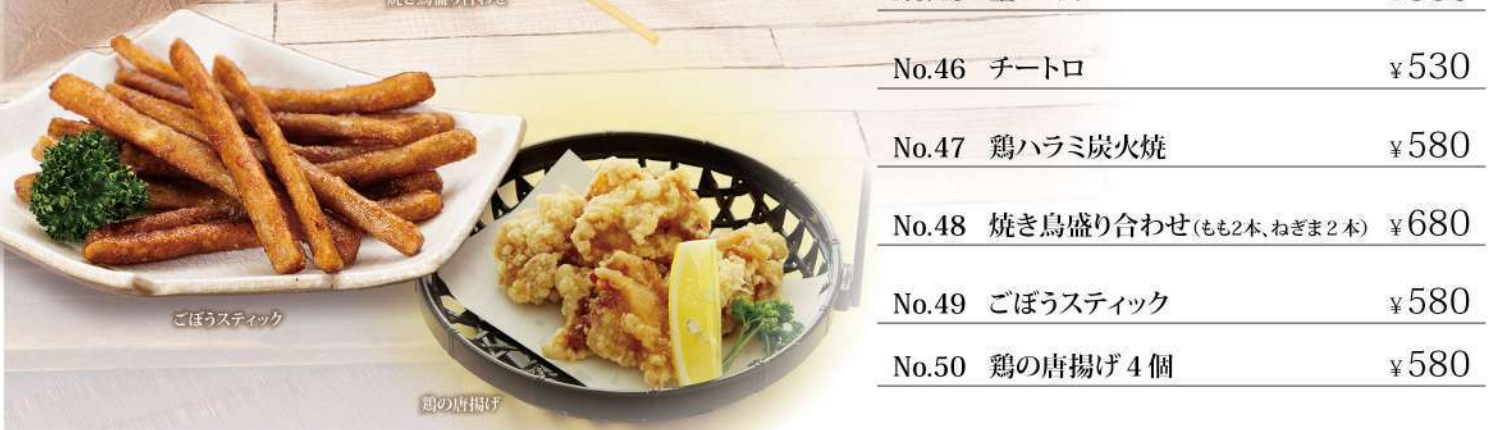
ごぼうスティック