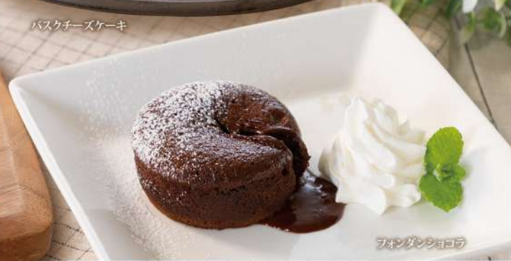
フォンダンショコラ