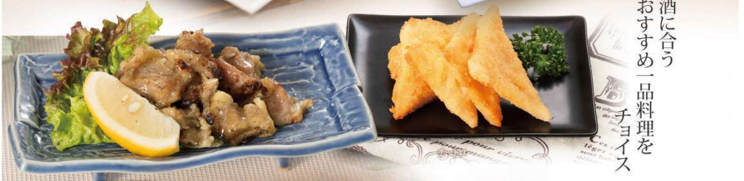
鶏ハラミ炭火焼き