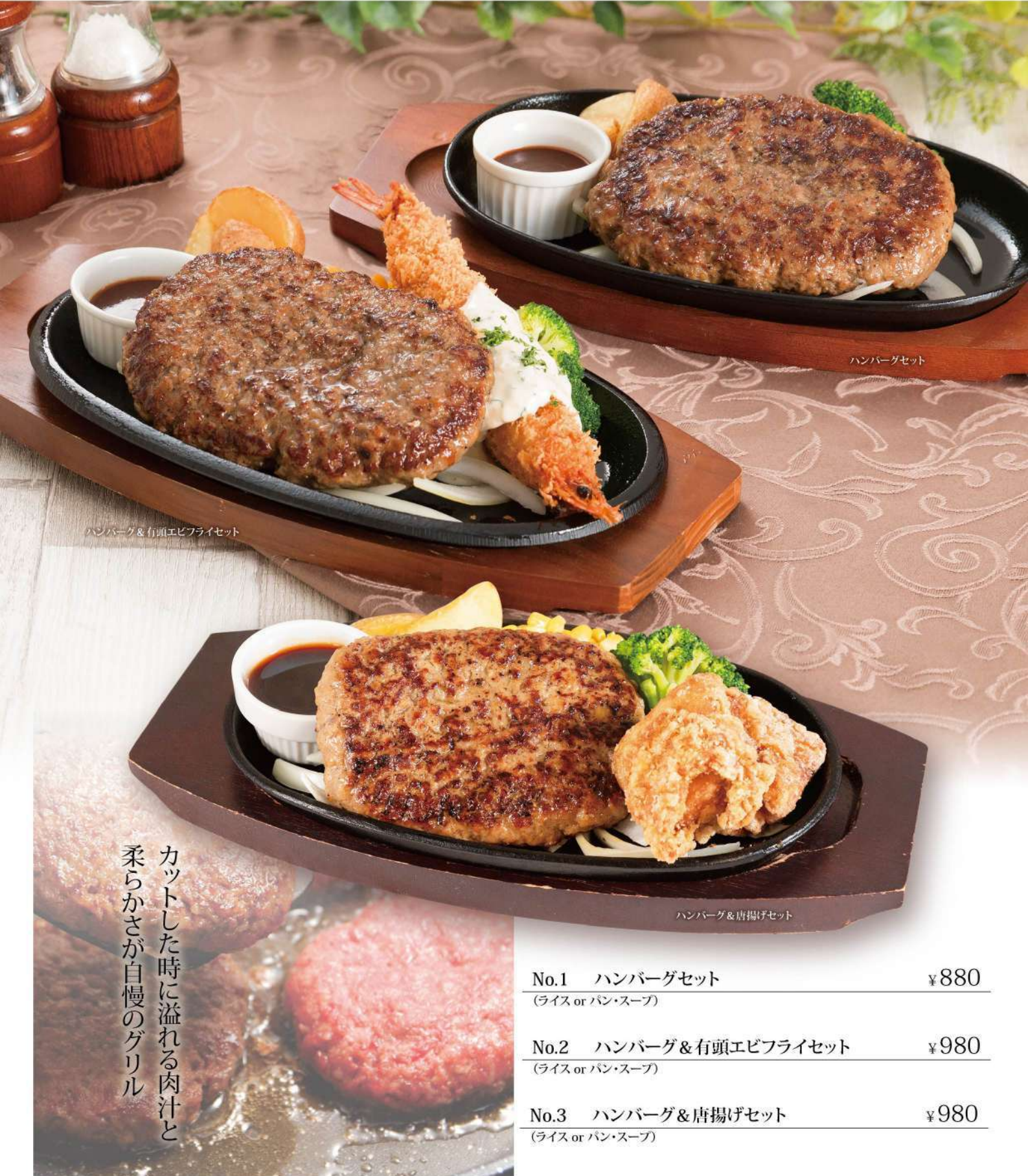
ハンバーグセット