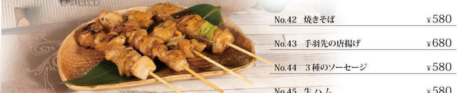
焼き鳥盛り合わせ