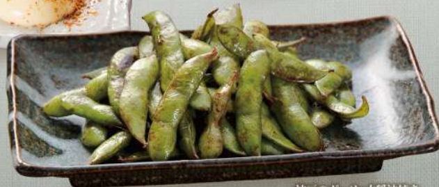
枝豆のガーリック醤油焼き

テレビ画面又はフロント9番にて、ご注文頂けます。オーダー時間 24時間受け付けております。