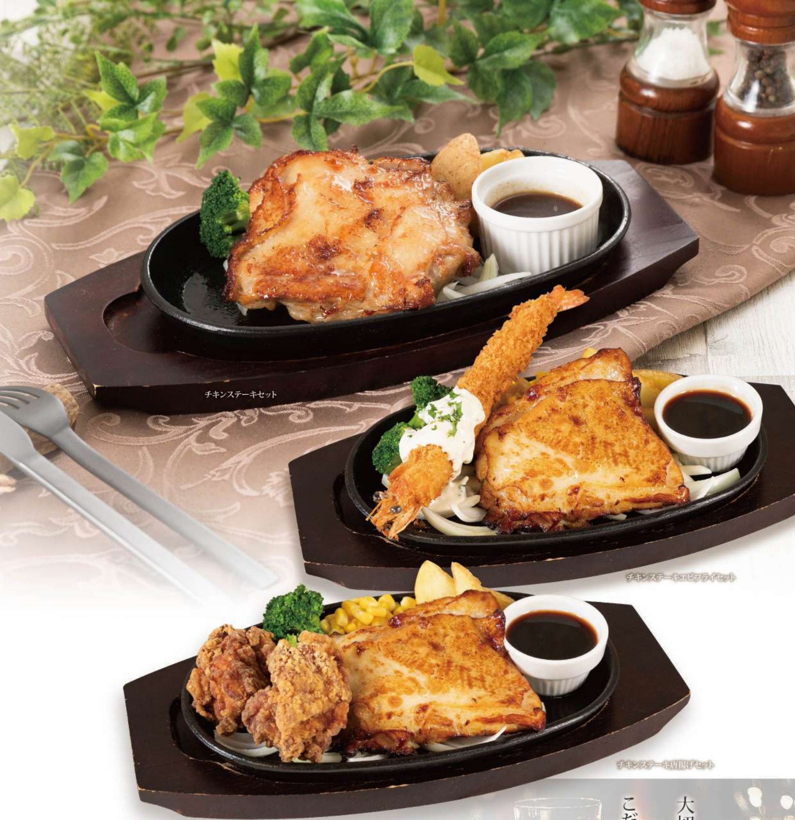
チキンステーキセット