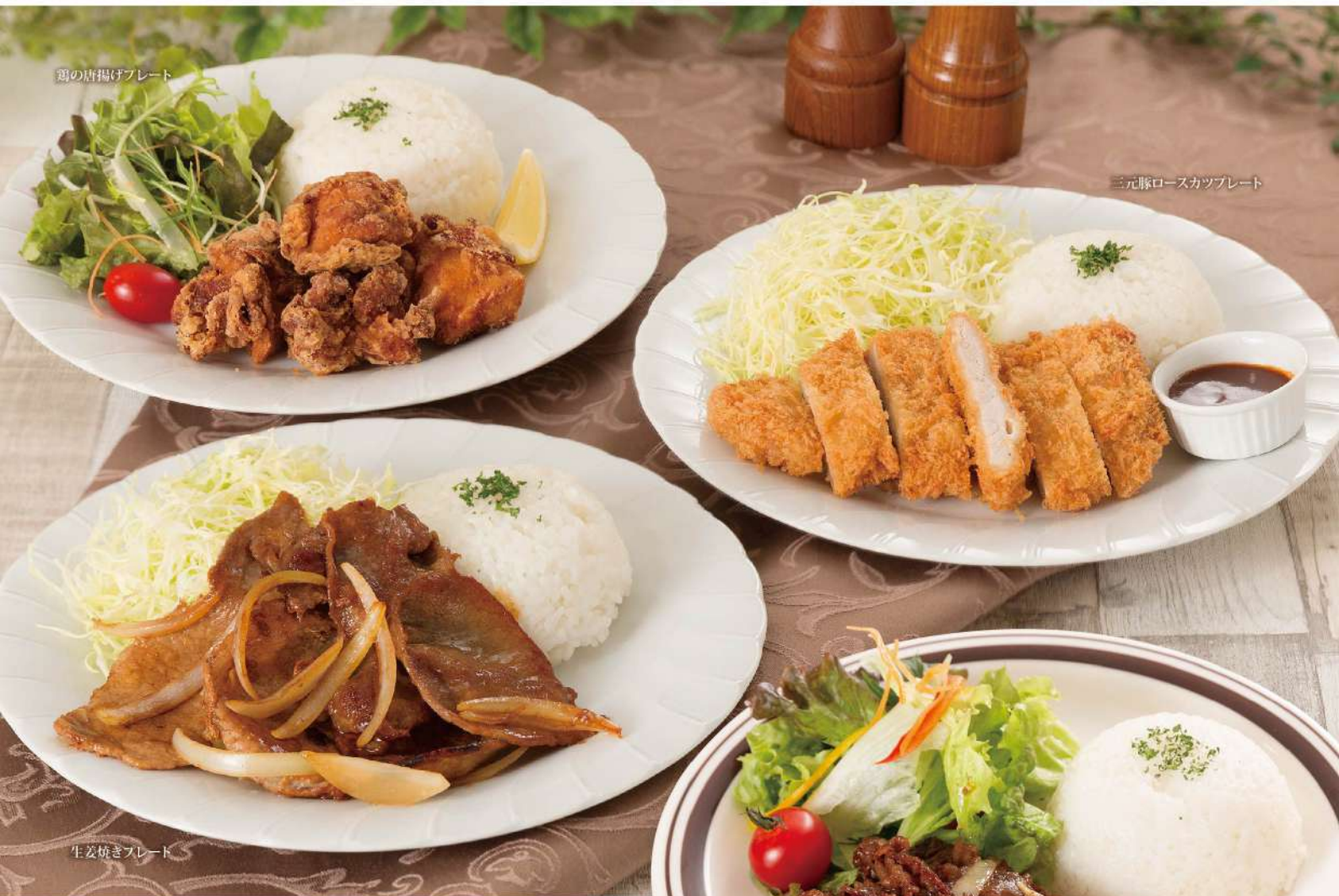
鶏の唐揚げプレート