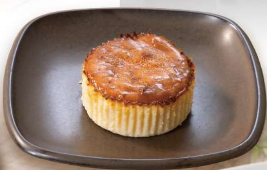
バスクチーズケーキ