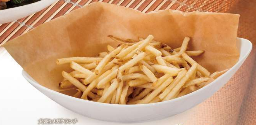
大盛りメガクランチ